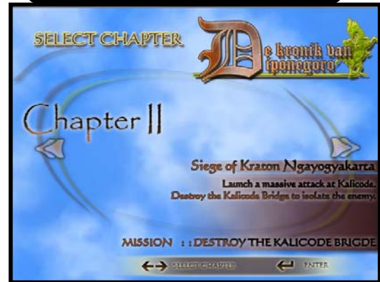
Desain ketika memilih skenario