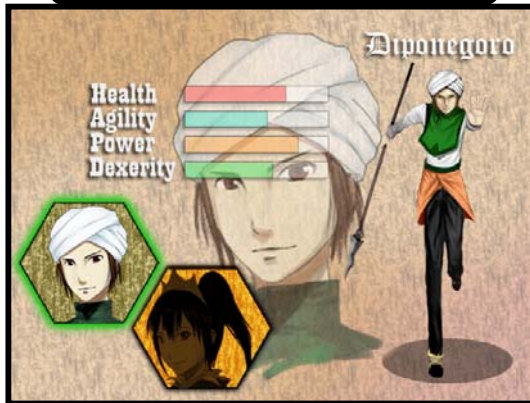
Desain ketika memilih tokoh