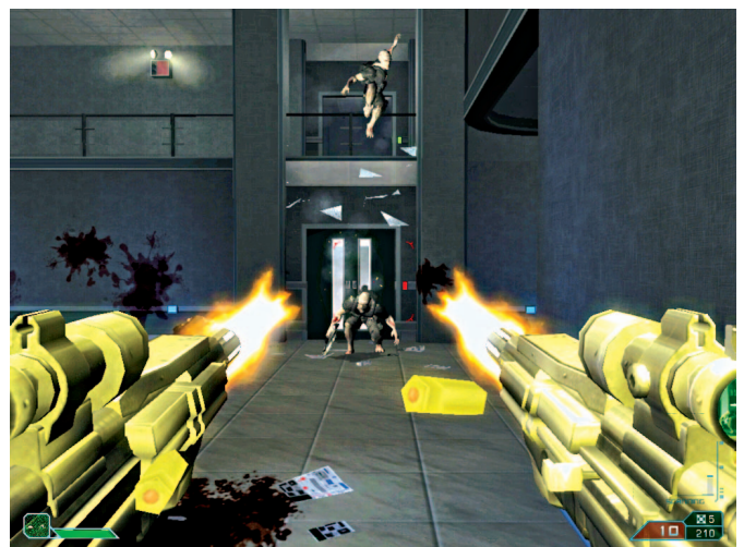
Cole memiliki kemampuan untuk menggunakan dua senjata sekaligus, di tangan kanan dan kiri.