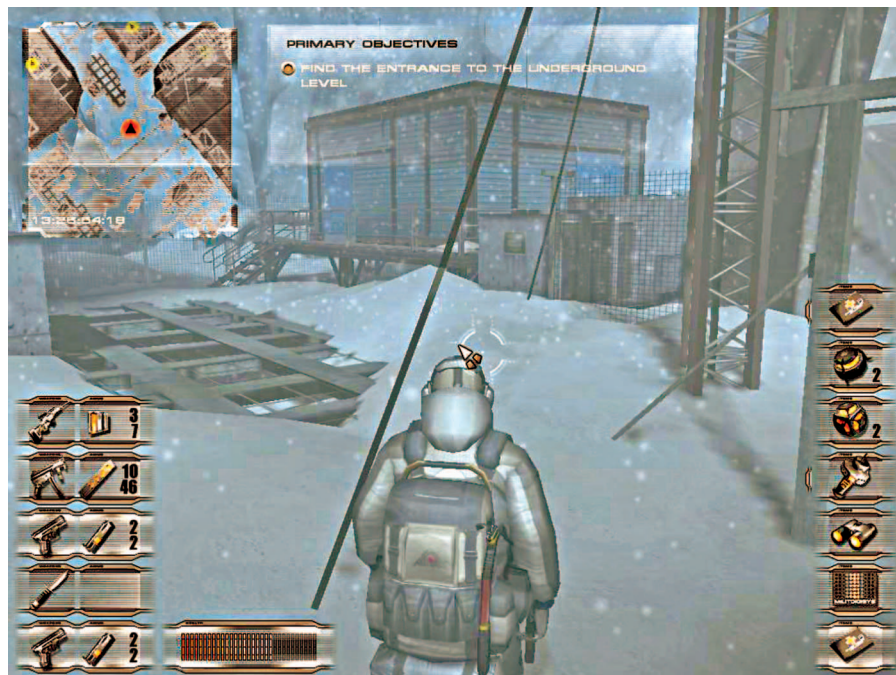
Menekan tombol Tab akan membuka inventory dan petunjuk mengenai misi yang harus dituntaskan.

Bumbu survival horror sedikit banyak memeriahkan game ini. Namun, permainan pada Aurora Watching tetap menekankan pada aksi secara diam-diam. Akurasi dan efektivitas tembakan mendapat penilaian tersendiri.