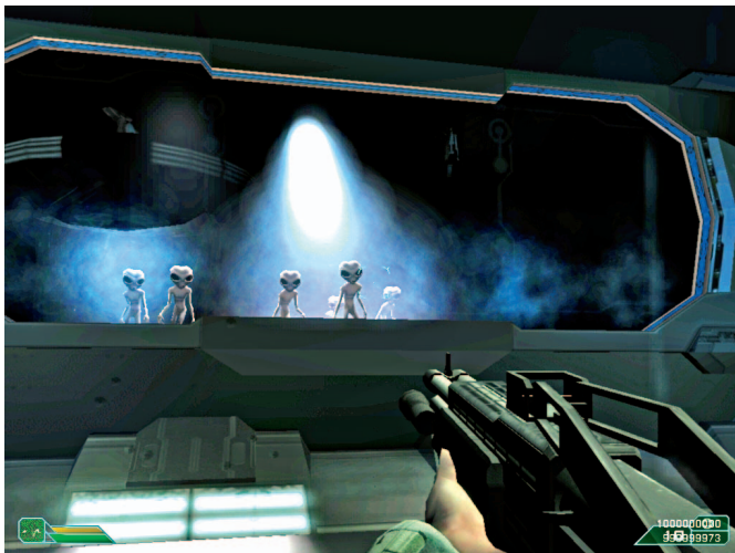
Gray atau alien tidak bertempur secara langsung. Mereka menciptakan Black Ops dan berlindung di balik shield .

Aktifkan jembatan. Turun melalui jalur tadi menuju jembatan tersebut. Hadapi pertempuran di ruang turret. Sebrangi jembatan ke UFO. Savepoint: Road to the Core. Masuki UFO. Tembaki setiap "jendela" Core. Berlindung dari api yang menyembur dengan shield merah transparan yang mengitarinya. Hancurkan turret yang muncul. Anda punya waktu 45 detik untuk keluar. Jika sempat, scan item dekat pintu keluar terakhir ( Galaxy Portal ). ■