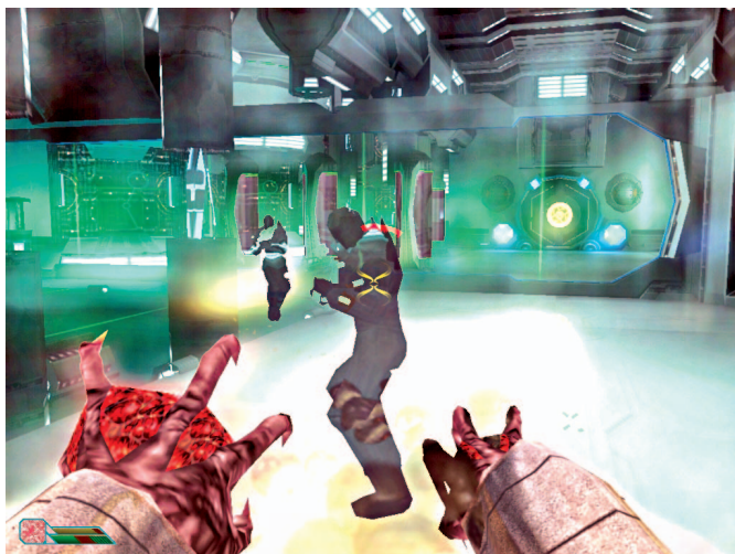
Pada pertengahan game, Cole bisa mengubah diri menjadi mutant . Gunakan taktik ini untuk menghadapi situasi tertentu.

Tembak setiap leaper. Seberangi jembatan. Ke kiri, dan naiki peti. Scan dokumen di belakang ( Population Control Documentation ). Ikuti alur. Turun ke platform di bawah melalui tangga kanan. Turun lagi ke pipa. Merunduk dan ikuti alurnya. Sesampai di ruang tertutup. Naiki tangganya dan scan dokumen ( Cloaking Device Report ). Aktifkan security lock-down . Keluar dari ruang ini. Menuju pintu seberang.