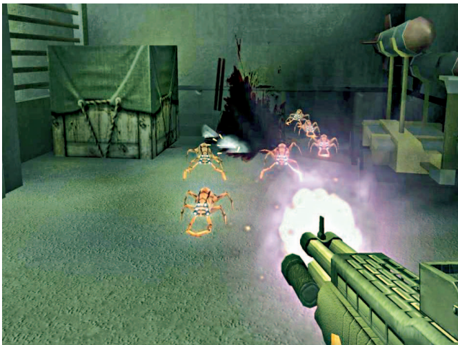
Salah satu musuh kecil tapi menjengkelkan, Mites. Mahluk ini sulit dibidik jika berada di bawah Anda.

Scan blue-print ( Alien Grenade Specifications ). Cari kepala, ambil, dan gunakan pada retina scanner. Masuki pintu yang