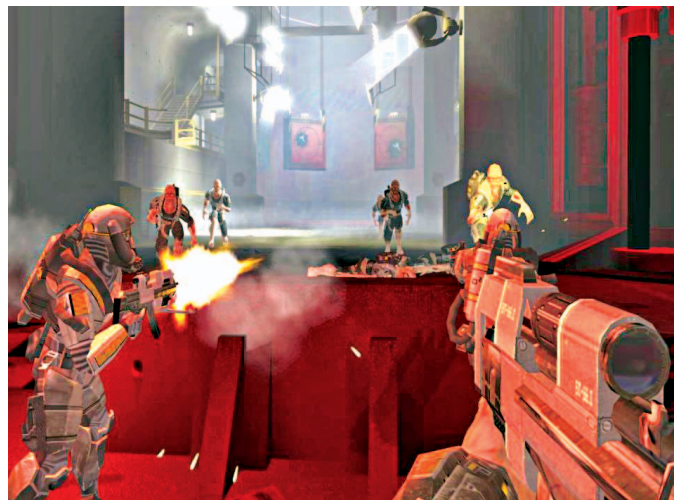
Serbuan mutant yang nyaris tanpa henti terjadi ketika Anda harus mempertahankan bunker bersama tim Delta.