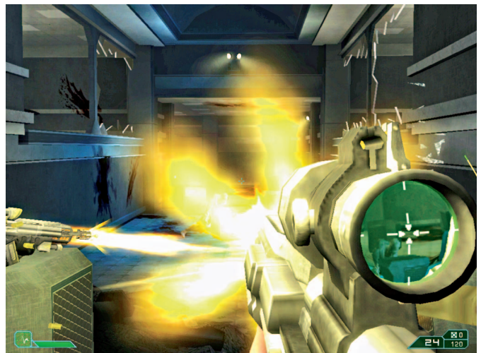
Lensa senjata ini bisa menampilkan sasaran, tapi sebaiknya abaikan itu. Akurasi tembakan hanya sesuai dengan crosshair .