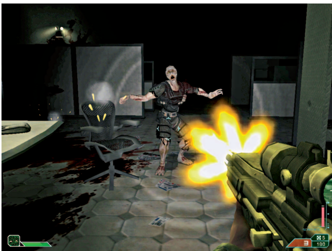
Mutant dalam game ini cukup tangguh. Mereka dapat bergerak cepat, dan beberapa di antaranya juga bersenjata, termasuk memiliki granat.

Kembali ke ventilasi tadi. Gunakan tool pada power yang rusak. Selanjutnya akses Radio Comm di bunker. Ikuti Chew. Masuki ruang kanan dulu, scan dokumen di rak (Congressional Disinformation). Masuki pintu yang dibuka Chew. Naiki titian besi keatas peti. Naiki platform, dan turun ke ruang satunya. Ambil amunisi, tembak mutant dan mite. Titi besi ke atas. Sebelumnya, ikuti boks menuju platform di kanan. Ikuti platform, titi tembok tengah, dan loncat ke peti besar di samping titian besi tadi. Loncat ke atas platform, dan loncat ke peti seberang. Scan objek di atas peti ( Unidentified Metallic Substance ). Se-