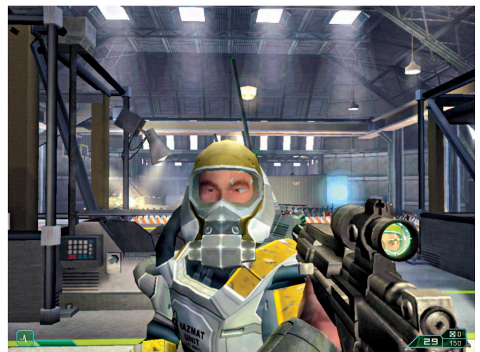
Jangan khawatirkan keselamatan rekan Anda di Area 51. Mereka bisa diandalkan dan hanya akan terbunuh hanya bila skenario mengharuskannya.