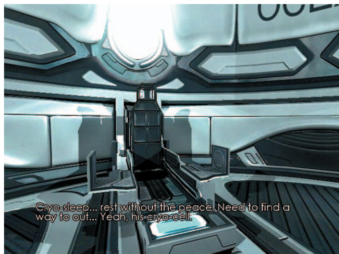
Cryo-sleep... rest without the peace. Need to find a way to out... Yeah, his cryo-cell.

Catatan: Dalam percobaan, cheat godmode dalam game ini tidak berfungsi. ■