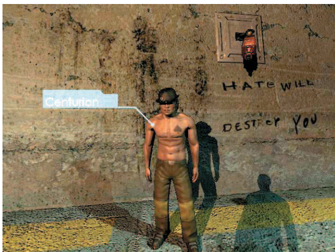
Ini adalah Centurion. Ia bertugas mengatur pertarungan dan menentukan siapa lawan yang harus dihadapi.

Anda sampai di ruang terbuka. Bereskan semua penjaga. Masuki pintu itu dan