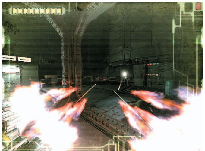
Gunakan Riot Guard, dan habisi semua penghadang yang muncul. Berhati-hati dengan bagian punggung karena di situ kelemahan Riot Guard.