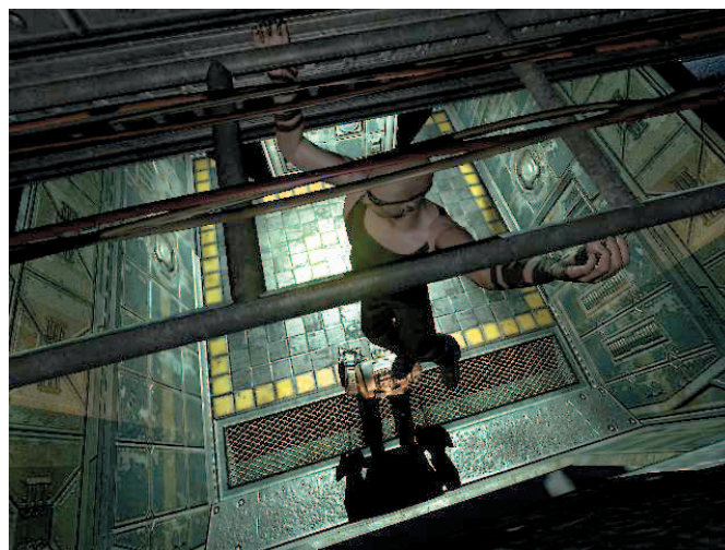
Berjalan tergantung di atas hangrail merupakan salah satu kehebatan Riddick. Lewati Riot Guard di bawah.