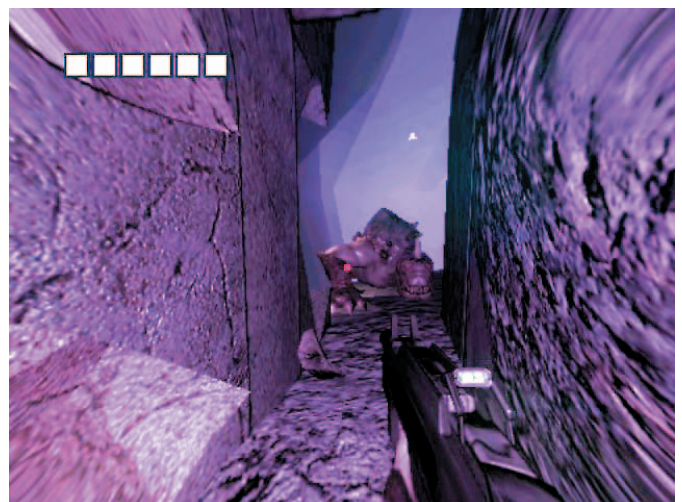
Makhluk diluar itu adalah monster Xeno yang besar. Jangan khawatir, monster ini paling banyak hanya dua, selebihnya hanya Xeno kecil.