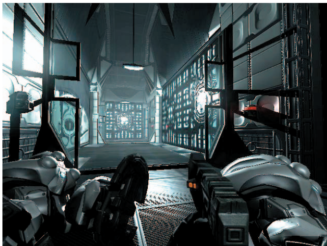
Beginilah rasanya berada dalam Heavy Guard . Biarpun dalam ruangan yang cukup sempit, gunakan terus sampai Anda diminta turun.

Sampai di bawah, akses powerbox . Ikuti alur hingga bertemu mesin bor raksasa. Masuki lubang gelap di kiri. Anda akan berada di sisi lain jembatan dengan mayat