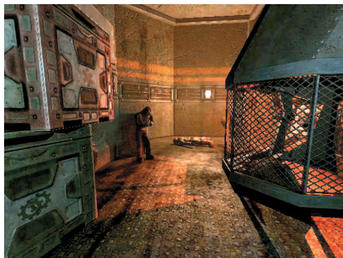
Orang yang berdiri di situ adalah Armadaro. Belilah Tranq Gun darinya, senjata ini sangat berguna karena Anda tak punya senjata api yang bisa digunakan.

Jalan dan naiki tangga. Ikuti alur. Akses panel boks di samping mesin untuk mematikan guard rail defense system . Ikuti alur, pancing Riot Guard untuk mendekati valve . Ledakkan valve . Masuki lorong gelap di samping container kanan. Bicara dengan Jagger Valance. Ikuti alur dan bunuh penjaga yang ada. Anda akan sampai di pintu berpita. Buka dan ikuti gas merah, loncat ke atas