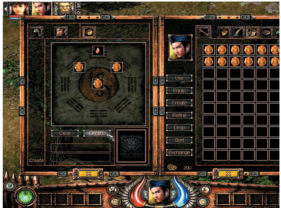
Game ini memberi fitur untuk menciptakan dan meng-upgrade senjata, armor, dan perlengkapan lainnya.

Game ini mirip dengan Prince of Qin. Selain grafik, kesamaan juga ditemui pada sistem skill yang mengacu pada filosofi lima elemen. Efektivitas serangan dan pertahanan sangat tergantung pada elemen yang digunakan oleh musuh atau karakter Anda. Misalnya, api tidak akan