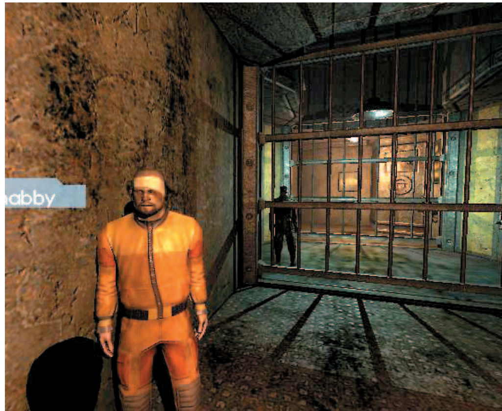
Orang ini bernama Shabby, sedang penjaga di belakangnya adalah Boulder. Keduanya pegang peran penting di chapter 3 dan 4.

► Karena banyaknya chapter yang harus diselesaikan, maka keterangan dibuat sesingkatnya. Saat Riddick tak memiliki senjata api, berarti ia harus membunuh lawannya secara diam-diam ( sneak kill ). Jika ingin mendapat quest tambahan, bicaralah dengan NPC lain. "Walkthrough" ini juga tidak secara lengkap memberi tahu Anda mengenai penjara