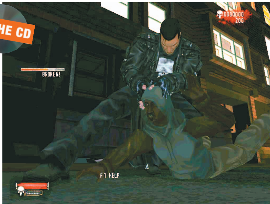
Mode interogasi menjadi keunikan game ini. Sama seperti citra yang dibangun, mode ini juga sarat kekerasan.

Selain membunuh, Frank bisa mengorek keterangan dari musuhnya. Mode Interogasinya tak kalah brutal, tapi sangat unik. Anda harus menggerakkan mouse sedemikian rupa untuk memberi "tekanan" pada musuh. Musuh akan